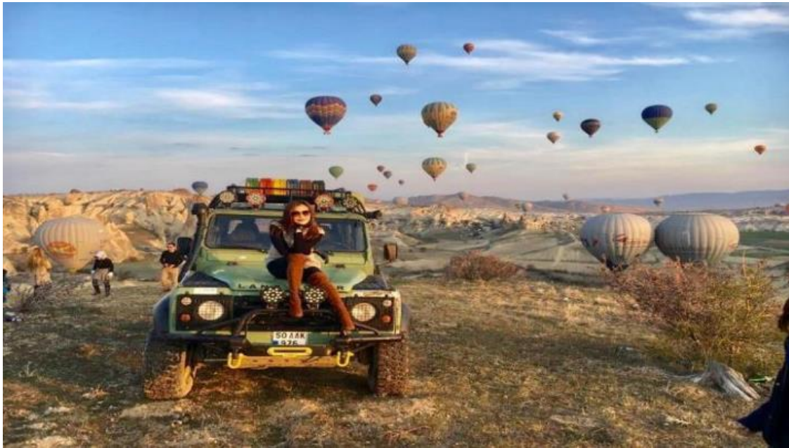
3. Classic Car นั่งรถคลาสสิก เปิดประทุน สูดอากาศ เย็น สดชื่น พร้อมชมบอลลูนสีสดใส วิวเมือง คัปปาโตเกีย ค่าใช้จ่าย 120 USD / ท่าน